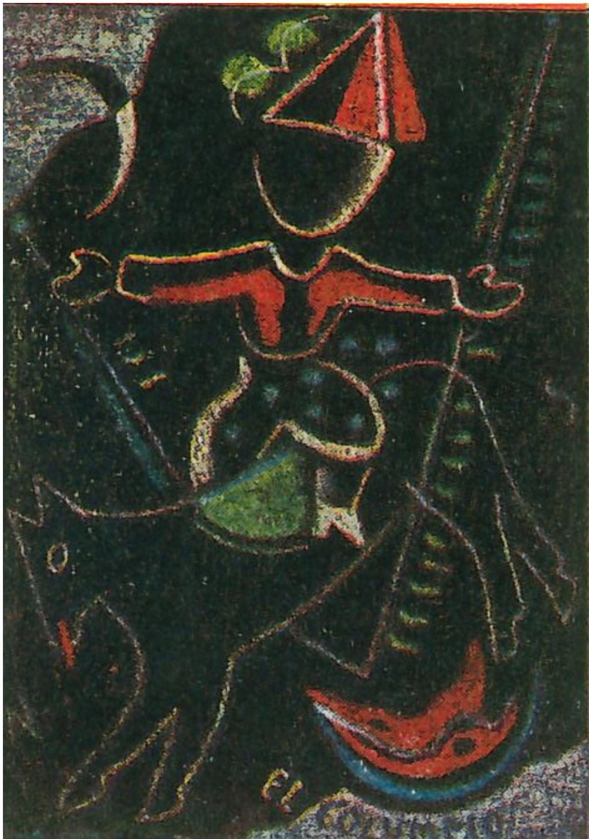
Primera viñeta de Maruja Mallo en Revista de Occidente . Julio 1931