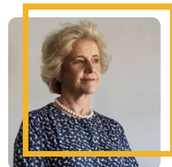
Democracia Soledad Becerril Bustamante